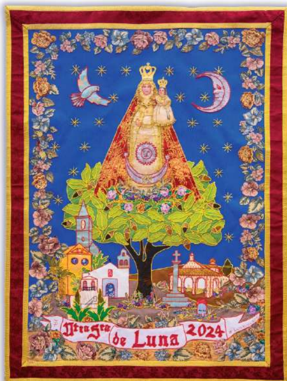
Pozoblanco 2/5 febrero

Debido a la normativa de protección de datos, toda persona que quiera aparecer en las hojas informativas deberá ponerse en contacto con algún miembro de la junta para notificarlo o indicarlo a través de nuestro correo electrónico: aaaaconcepcionistas.pozoblanco@gmail.com