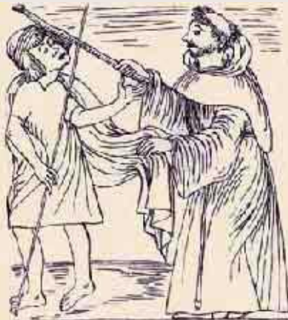
Fraile castigando a un siervo

Este es el cuarto amo de Lázaro. Es el amo que le da su primer par de zapatos. Es un fraile corrupto y promiscuo. Las ansias de Lázaro en este momento no eran las mujeres, sino la comida.