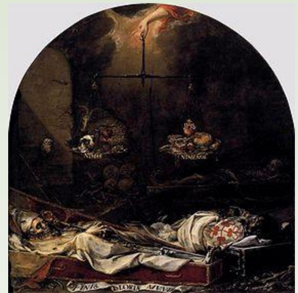
Finis gloriae mundi Valdés Leal. Sevilla.