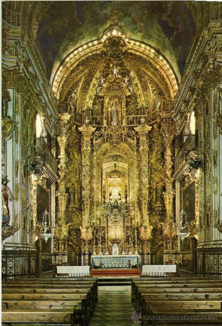
Basílica de San Juan de Dios Granada