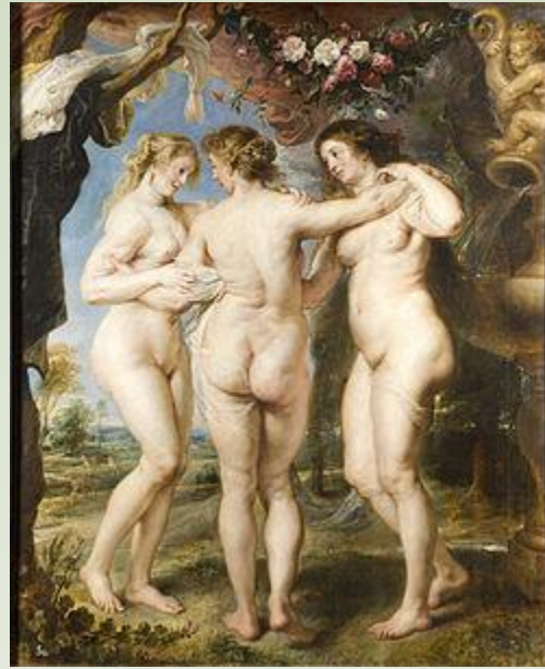
Las tres gracias. Rubens. El Prado.