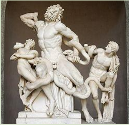
Lacoonte y sus hijos. Polidoro de Rodas. Vaticano.