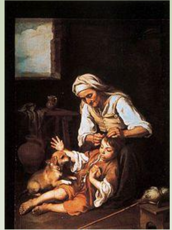
Vieja espulgando a un niño. Murillo. Munich.